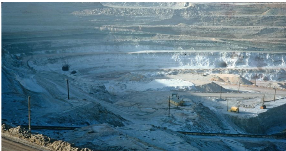
Borax-Bergbau in Boron, Kalifornien

Selbst die niedrig dosierten und weniger effektiven Bor-Tabletten werden von der Pharma-Industrie streng überwacht. Ihr Verkauf kann durch Vorschriften im Codex Alimentarius jederzeit eingeschränkt werden. Damit hat die Pharmaindustrie alle von Borax ausgehenden Gefahren unter Kontrolle gebracht und ihre Profite und ihr Überleben gesichert